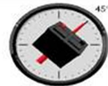
TRADITIONAL No spill at 45° maximum rotation