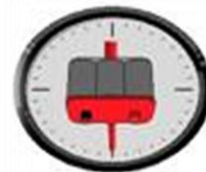
OPTIMA No spill at 180° maximum rotation